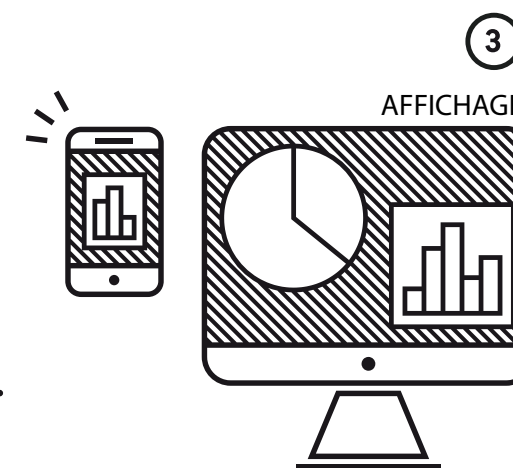
DÉTECTION D'INTRUSION / BUSINESS INTELLIGENCE